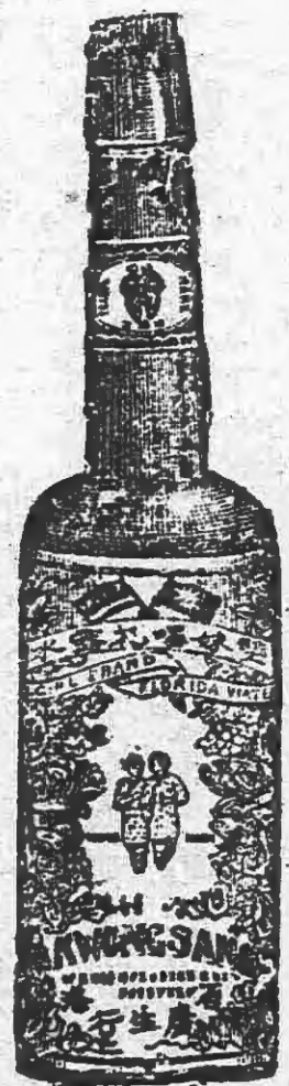
大號五角六 貳號三角半 三號貳角壹 四號壹角四